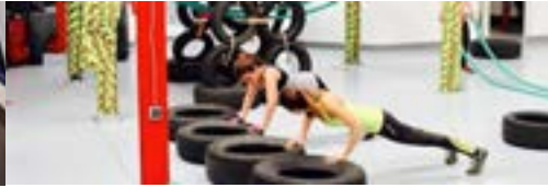
Salle et cours de sport