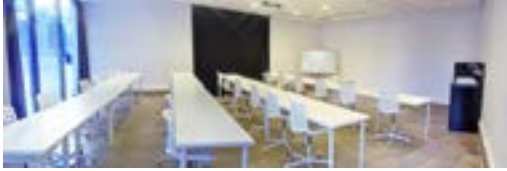
Wifi haut débit et webinars