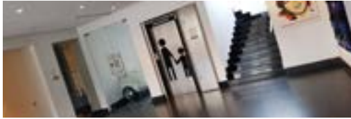
De l'espace, de la modernité