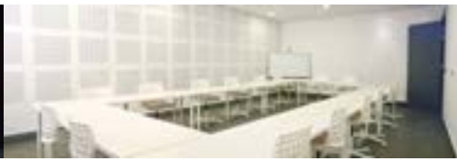
Salles de cours ergonomiques